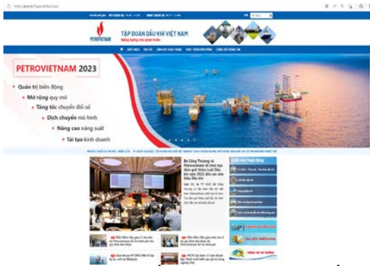
Webiste chính thống của Tập đoàn Dầu khí Việt Nam sử dụng tên miền quốc gia “.vn” (pvn.vn)